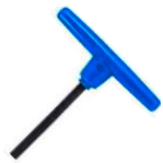
T-Griff / T-handle 5 mm Innensechskantschlüssel / 5mm hex key